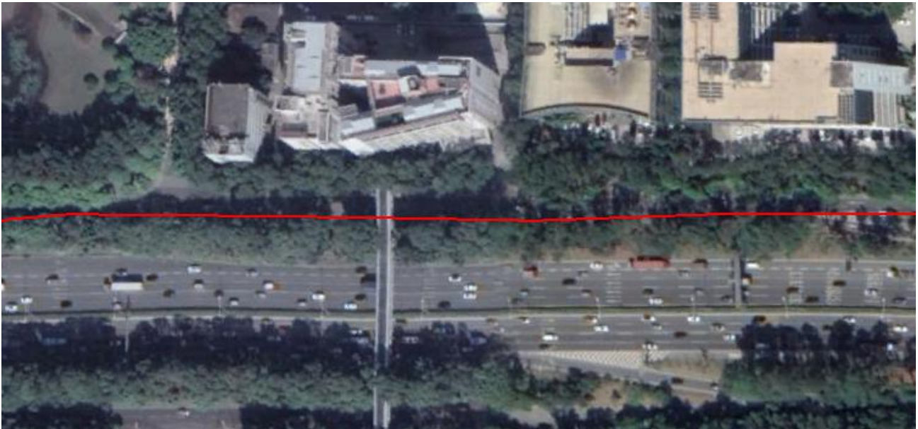
图 1 林荫道路路线轨迹图