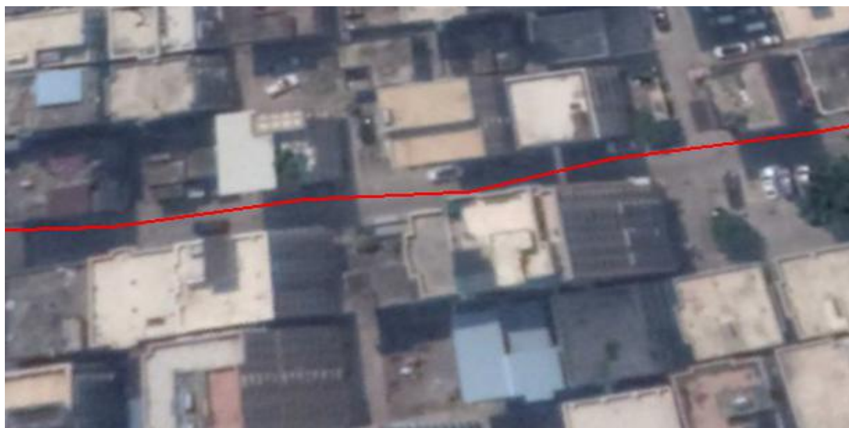
图 4 城市峡谷路况路线轨迹图

测试地点为深圳市钟屋社区，道路两侧高楼林立，可验证城市峡谷对设备精度的影响，整体路线轨迹图如下：