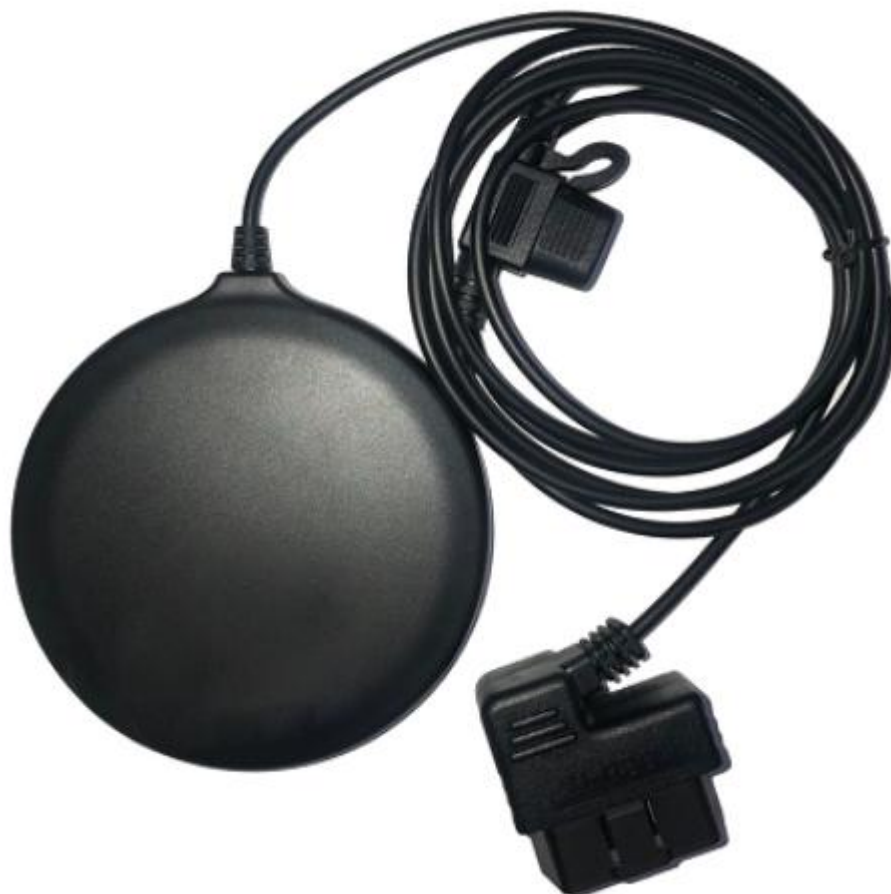
图 1 RAC-TR1 高精度卫星定位追踪器示意图

此产品是基于 2G/4G 网络和 BD+GPS 卫星为基础，通过短信、应用程序和互联网，实现对任何远程目标的定位和监控。采用最先进的 GPS 和 AGPS 双定位技术。内置卫星接收天线，定位精度可以达到动态小于 1.5 米，能满足车道级车辆定位跟踪的需求。通过技术创新，产品具备两大核心竞争优势，即无需差分站、不使用 L2 或 B3 精码、因而成本低廉。与传统的高精度卫星定位技术不同，我们的技术摆脱了高精度卫星定位所依赖的差分技术，使成本大幅下降，这是我们领先于世界同类产品最重要的优势。本产品具有高精度、高灵敏度、低功耗、体积小型化的特点，其极高的追踪灵敏度大大扩大了其定位的覆盖面。