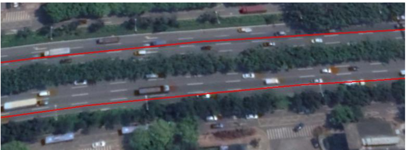
图 2 正常道路路线轨迹图